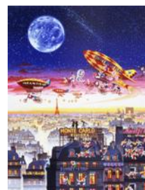
Fly me to the moon