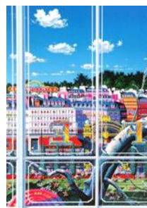
Parc de Monceau